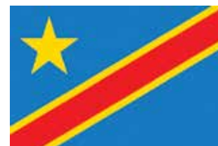
République démocratique du Congo