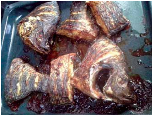
Tilapia directement sorti du four